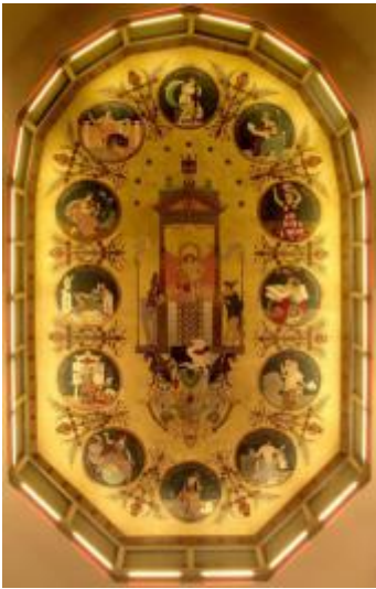
Techos del Salón de Actos