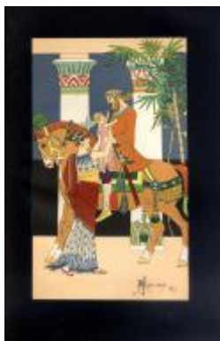
Despedida de Sappfó y Bardiy

Fondo Arturo Mélida y Alinari (1882-1895): podemos leer las cartas que el artista recibió sobre asuntos del Ateneo, ahora digitalizadas en el archivo .