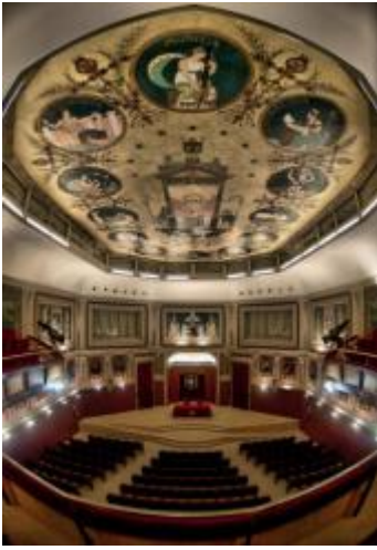
Salón de Actos