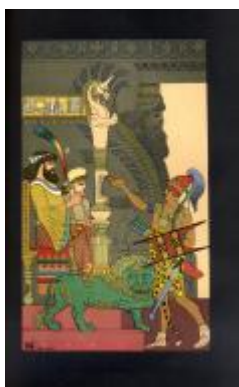
El embajador masageta ante Kambises